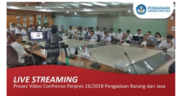
LIVE STREAMING Proses Video Conference Perpres 16/2018 Pengadaan Barang dan Jasa