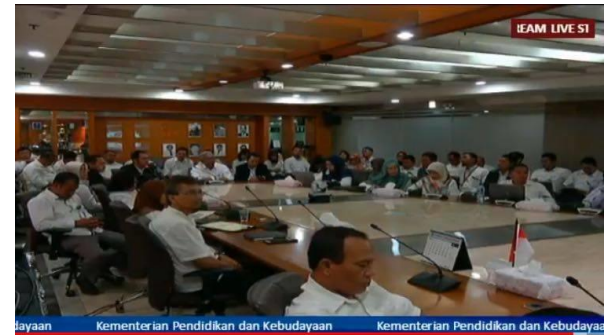
Video Confrence Sosialisasi Perpres 16/2018 Tentang Pengadaan Barang dan Jasa